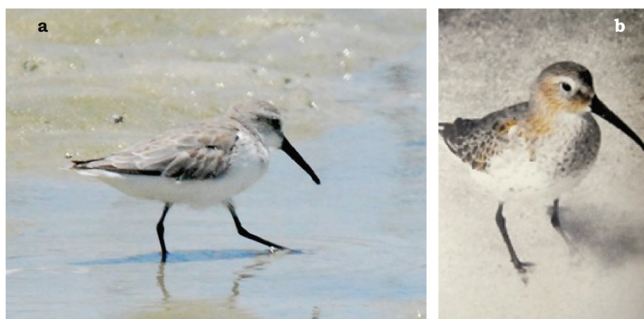
FIGURA 2. Individuos del Correlimos Calidris alpina fotografiados en Punta de Mangle, isla de Margarita. En (a) se aprecia un individuo con la coloración típica de su plumaje de invierno, mientras que en (b) se muestra un individuo con reminiscencia de su plumaje nupcial o de nidificación.

Estos registros insulares evidencian que el Correlimos estaría utilizando, regular o eventualmente, la ruta del oeste del Atlántico (McNeil y Burton 1973, Burton y McNeil 1975) como vía alterna durante su migración otoñal.