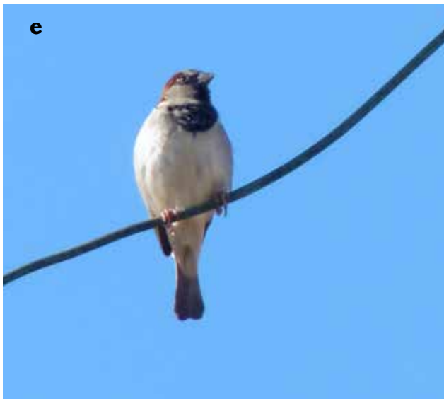
FIGURA 1. Registros recientes del Gorrión Común Passer domesticus en Venezuela: a) macho observado en San Juan de los Cayos en 2010, estado Falcón b) hembra y c,d) machos, observados el 29 de junio del 2012 en Pedregal, estado Falcón e) macho observado el 30 de diciembre de 2012 en el Refugio de Fauna Silvestre y Reserva de pesca Ciénaga de los Olivitos, estado Zulia.

Recibido: 22/01/2013 - Aceptado: 22/10/2013