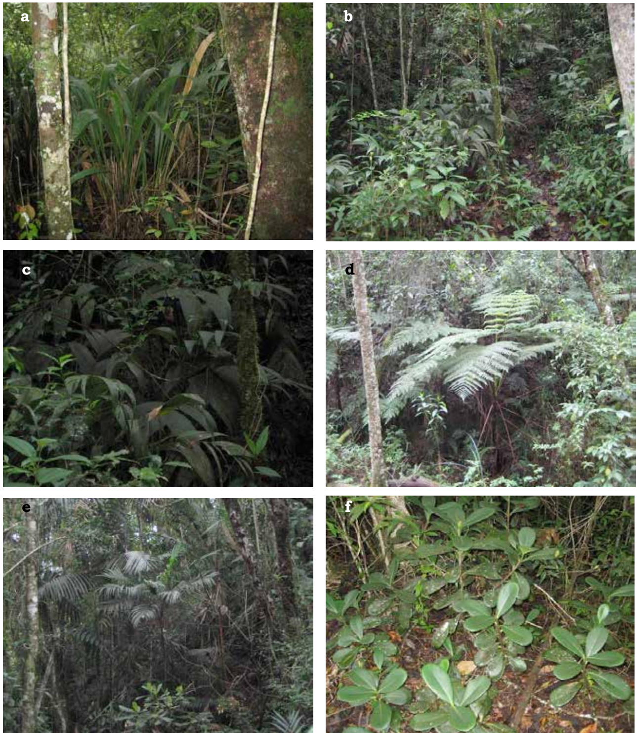
FIGURA 2. Detalles del bosque nublado estudiado en el Monumento Natural Pico Codazzi, sector El Bosque, municipio Carayaca, estado Vargas. a, plantas de Neurolepis pittieri ; b, estructura del bosque; c, Geonoma undata (Arecaceae); d, Cibotium (Pteridaceae); e, las palmas, un elemento indicador de los bosques nublados; f, Clusia grandiflora (Clusiaceae).