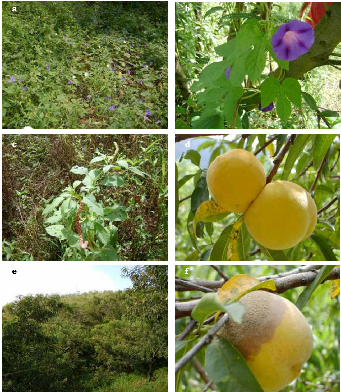
FIGURA 1. Detalles del duraznero Prunus persica estudiado en la unidad de producción La Leal, Municipio Tovar, estado Aragua. a,b,c, flores de las malezas Ipomoea (Convolvulaceae) y Phytolacca (Phytolaccaceae) visitadas por aves de Trochilidae; d, fruto de durazno; e, detalle del cultivo; f, fruto del durazno afectado por un hongo ( Monilla sp), un aspecto aprovechado por algunas aves como el Azulejo de Jardín Thraupis episcopus para consumirlos.